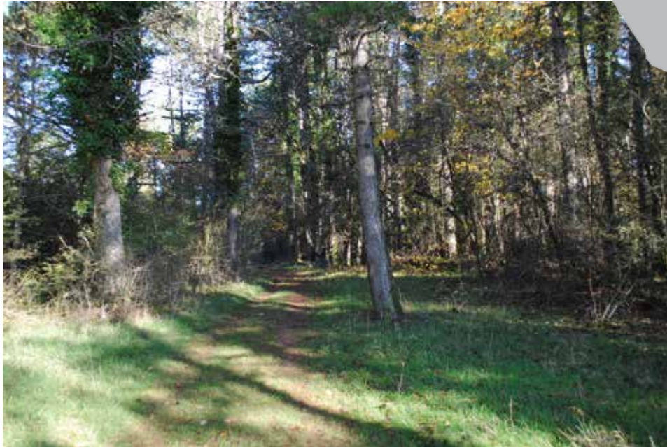
Le sentier traverse la pinède

Le chemin vous fait ensuite longer des pins noirs installés sur d'anciennes pelouses et vignes avec murets. La plupart furent semés en 1927 et leur densité est relativement élevée. Aussi, peu d'espèces végétales herbacées arrivent à se développer sous leur couvert trop ombragé et dans la couche épaisse d'aiguilles. Quelques orchidées, des épipactis essentiellement, peuvent parfois y trouver des conditions favorables, mais leur floraison reste très capricieuse. Lorsque l'irrégularité du couvert le permet, par exemple suite à la disparition d'un pin (phénomène accru par les sécheresses récentes), des espèces feuillues s'installent comme le chêne sessile, le charme, le hêtre ou l'orme. Leur développement reste cependant lent car le sol mince freine leur croissance. Tout