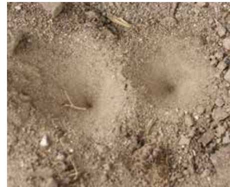
En haut. Pouillot véloce Ci-contre, milieu. Fusain d'Europe en fruits Ci-contre. Entonnoirs de larves du fourmilion Ci-dessus. Fourmilion adulte