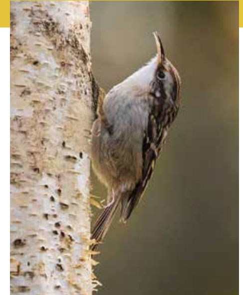
Ci-contre. Pic épeiche © Martha de Jong-Lantink Ci-dessus. Grimpereau des jardins © Carola Schellekens Ci-dessous. Écureuil roux © Martha de Jong-Lantink