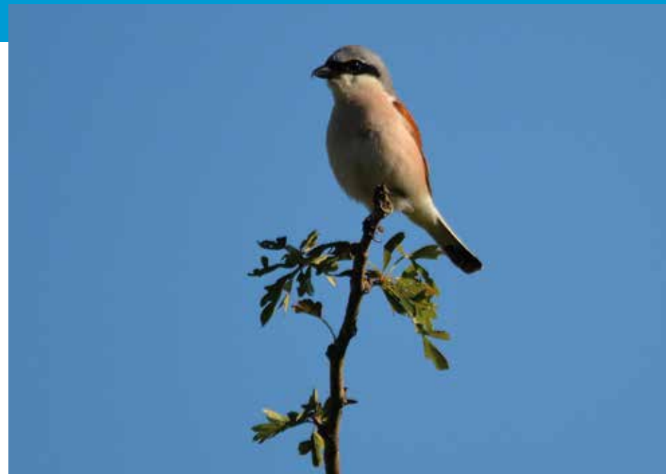
Pie-grièche écorcheur

Une promenade matinale sera peut-être pour vous l'occasion de surprendre la fauvette babillarde dont le chant puissant retentit au milieu des buissons.