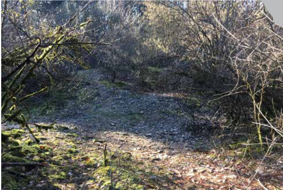
Les rayons du soleil commencent à réchauffer la "lavière"

Le chemin sinuant au milieu des pins donne vue sur une ancienne "lavière" où il est demandé de ne pas pénétrer pour sa conservation et la quiétude de la faune présente dans ce milieu particulier. Sans aucun rapport avec la lave volcanique, ce terme utilisé fréquemment dans tout le nord-est de la France, de la Bourgogne à la Lorraine, désigne d'anciennes zones d'extraction de dalles calcaires. Ces dalles étaient utilisées jadis pour la couverture des bâtiments et des murs de clos dont la longévité dépassait deux siècles. La toiture de l'ancien four à chaux situé dans le village de Frotey-lès-Vesoul en est le dernier témoin. La "lavière" est un milieu pierreux qui abrite des espèces végétales et animales adaptées à la chaleur et aux milieux pauvres en matière organique. La surface encore peu