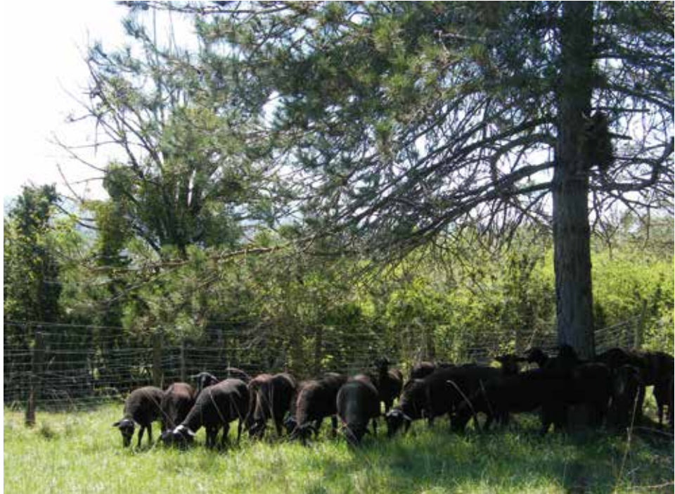
Brebis de race Noire du Velay