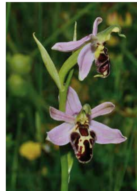
En haut. Mante religieuse © Patrick Viain Ci-contre, au milieu. Ascalaphe soufré © Patrick Viain Ci-contre. Zygène de la filipendule © Patrick Viain Ci-dessus. Ophrys du Jura © Patrick Viain