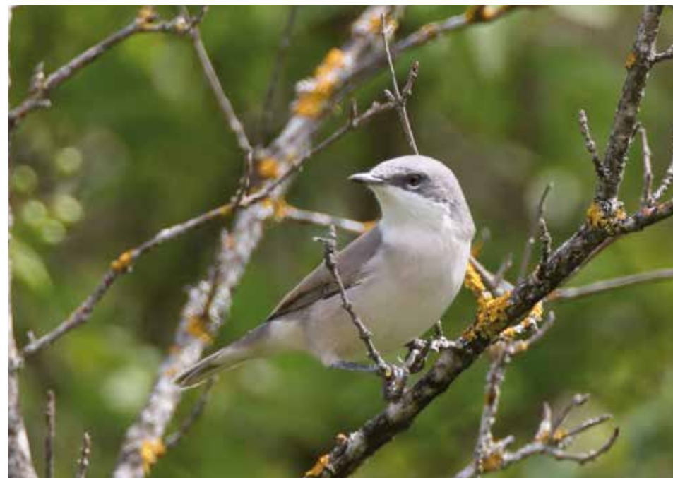
Fauvette babillarde