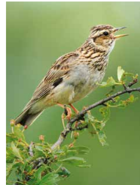
En haut. Flambé Ci-contre. Fruits du prunellier Ci-dessus. Alouette lulu