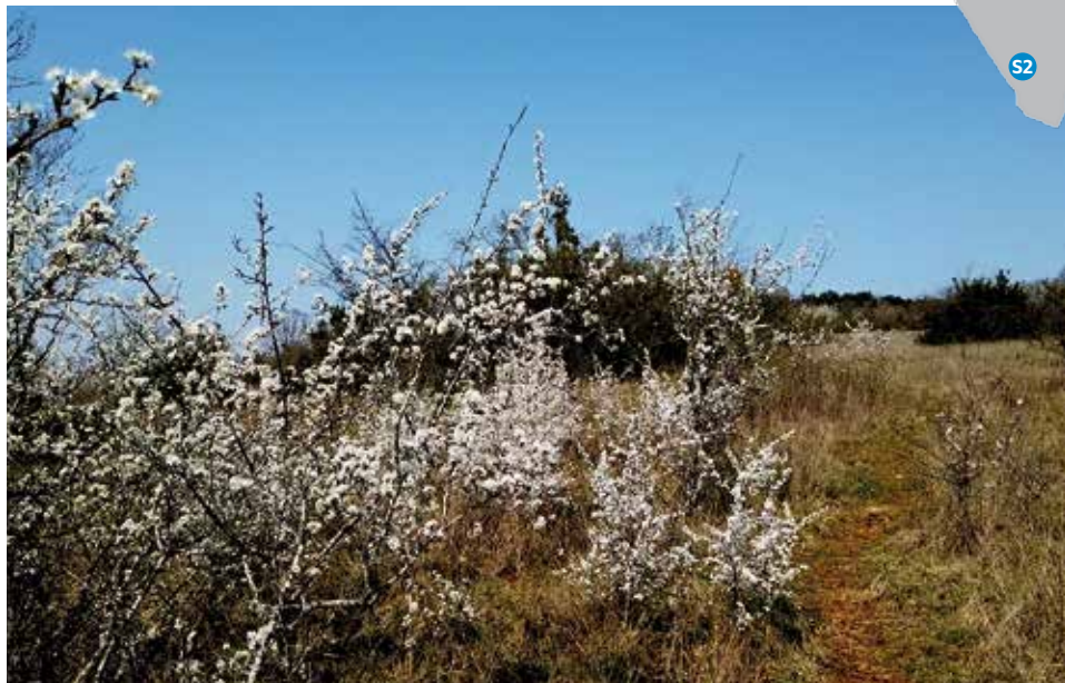
Prunelliers en fleur

Au cours de la balade, vous pourrez admirer les pelouses sèches de la Réserve. La pelouse apparaît sur des sols minces pauvres en éléments nutritifs et se différencie des prairies, notamment par une végétation moins fournie et moins haute, laissant le sol à nu par endroits. Elle est soumise ici à d'importantes périodes de sécheresse (accrues depuis quelques années) influencées par le type de sol, la géologie (sous-sol calcaire fissuré qui favorise l'infiltration des eaux de pluie), ou encore l'exposition et la pente.