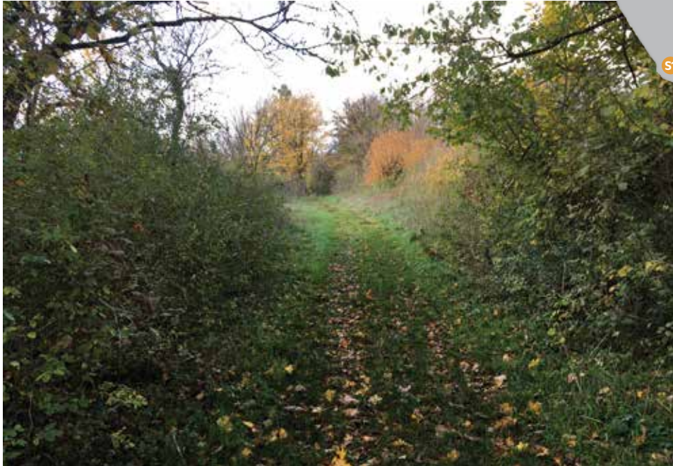
Le sentier chemine entre les haies

Depuis le parking de la RN 19, vous commencez votre périple le long des haies d'arbustes variés qui bordent le chemin. Vous y trouverez, entre autres, le fusain d'Europe, dont les fleurs verdâtres se transforment à l'automne en un fruit très décoratif à capsule rouge et graines orangées. Les fruits réduits en poudre servaient à éliminer les poux. Aujourd'hui, le fusain sert surtout à faire des "crayons" pour les dessinateurs. Vous découvrirez l'aubépine, qui se couvre en mai-juin d'innombrables fleurs blanches très odorantes. Ces haies servent d'abri à de nombreuses espèces animales et notamment aux oiseaux.