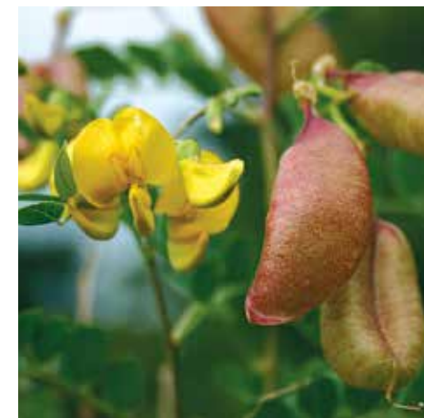
En haut. Faucon pèlerin © Fabrice Cahez Ci-contre. Hélianthème des Apennins © Patrick Viaïn Ci-dessus. Fleurs et fruits du baguenaudier © Patrick Viaïn