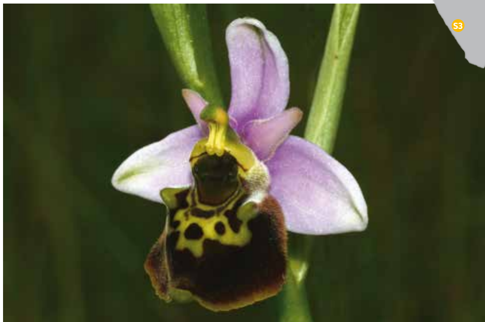
Ophrys frelon

Le sentier s'élève le long de la corniche et, au fur et à mesure, votre regard embrasse Vesoul, la plaine de Frotey-lès-Vesoul et revient sur la vaste pelouse sèche communale jalonnée de buissons.