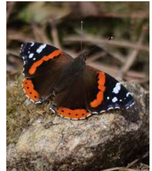
En haut. Lézard des murailles © Pierre Cheveau Ci-contre. Couleuvre d'Esculape © Pierre Cheveau Ci-dessus. Vulcain © Christian Chirio