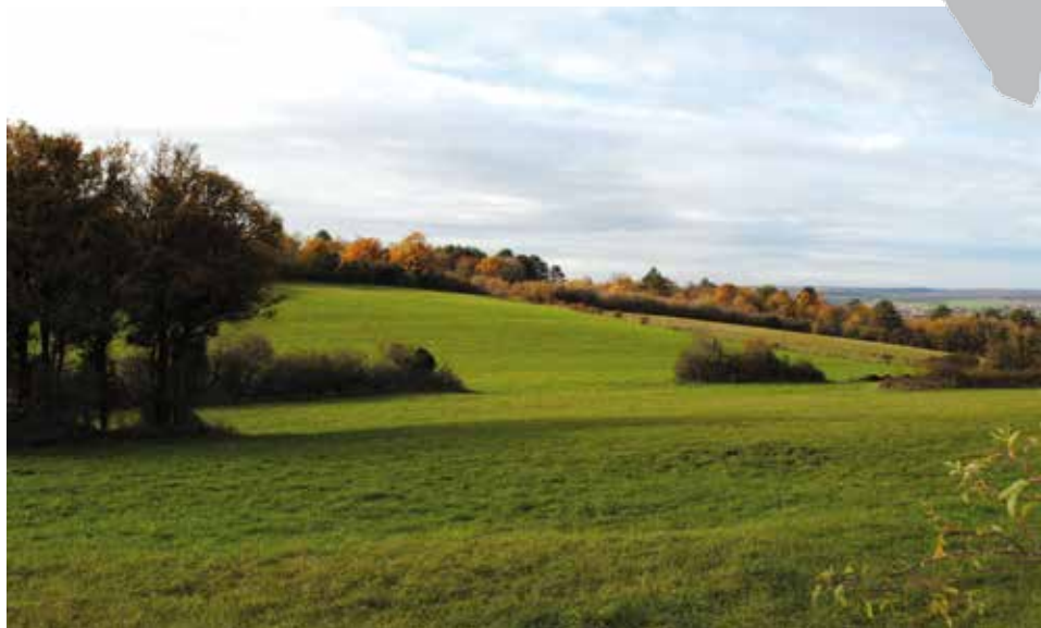
La Combe au Siron

Le secteur agricole de la "Combe au Siron", un peu vallonné, est riche en haies et bosquets feuillus. Ces milieux offrent abri et nourriture à de nombreux animaux. La circulation pédestre sur le chemin est la plus favorable à la découverte. Les véhicules à moteur, hors exploitants agricoles et services, sont d'ailleurs interdits.