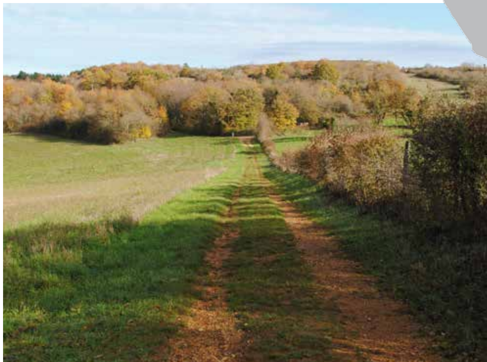
Le sentier longe cultures, pelouses et prairies

Sur le versant nord de la Réserve, vous trouverez une juxtaposition de prairies, pelouses, cultures. Au cours du printemps, vous pourrez rencontrer sur les talus de nombreuses plantes comme les trèfles, les coronilles, les scabieuses ou encore l'orchis pyramidal dont la couleur rosée attire l'œil. Plus tard en saison, un grincement émis du sommet d'un buisson vous permettra, peut-être, de repérer la pie-grièche écorcheur qui nourrit ses jeunes. C'est un prédateur dont la présence atteste de la qualité du milieu. En effet, les nombreux insectes qui peuplent les lieux (grillons, criquets, sauterelles...) constituent l'essentiel de sa nourriture.