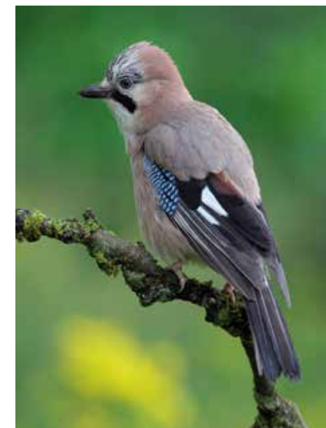
En haut. Engoulevent d'Europe Ci-dessus. Geai des chênes Ci-contre, milieu. Lièvre d'Europe Ci-contre. Grillon des champs