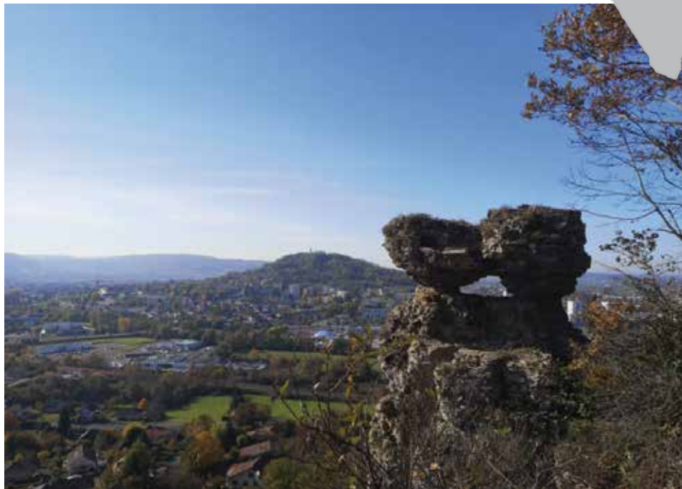
Le Sabot

Découvrez ici la figure rocheuse du Sabot (classé "monument naturel" par l'État au titre de la loi de 1906) sur la falaise calcaire du Bajocien, elle-même issue de vases marines âgées d'environ 150 millions d'années ! La plaine humide inondable du Durgeon et de la Colombine riche d'enjeux écologiques, ainsi que la colline de la Motte dominant le centre historique de Vesoul, offrent un paysage contrasté, où l'espace encore libre mérite attention.